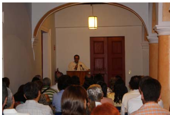
PERSONAL DEL ARCHIVO EN EL CIESAS GUADALAJARA