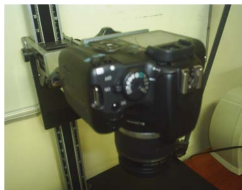
CAMARA ANTERIOR (2001)