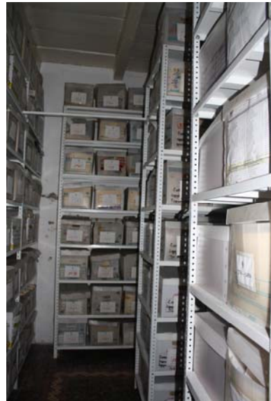
DESPUES (SEPTIEMBRE 2010)