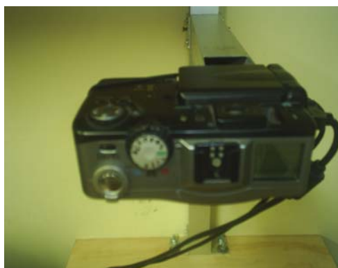
NUEVA CAMARA DIGITAL (2010)