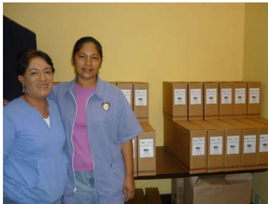
PERSONAL DEL ARCHIVO EN EL CIESAS GUADALAJARA