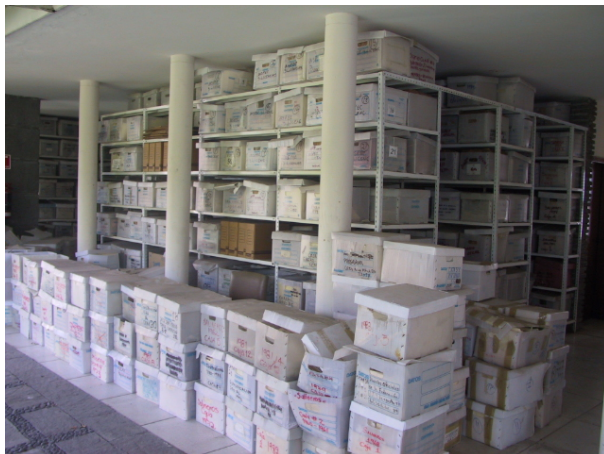
ANTES (JUNIO 2009)